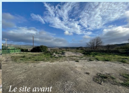
Le site avant