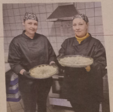
Un circuit court, des ingrédients locaux. Les bonnes recettes.