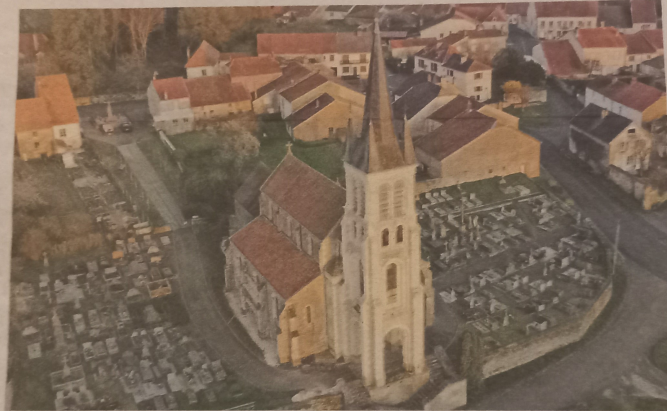
Église Saint-Pierre-ès-liens de Laferté-sur-Amance.