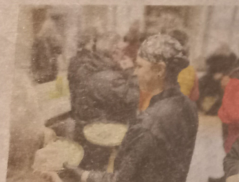
Des convives ravis. La Grande Évasion a marqué des points.

traiteur.lge@gmail.com, 06 21 23 01-68 ou 07 49 12 42 71.