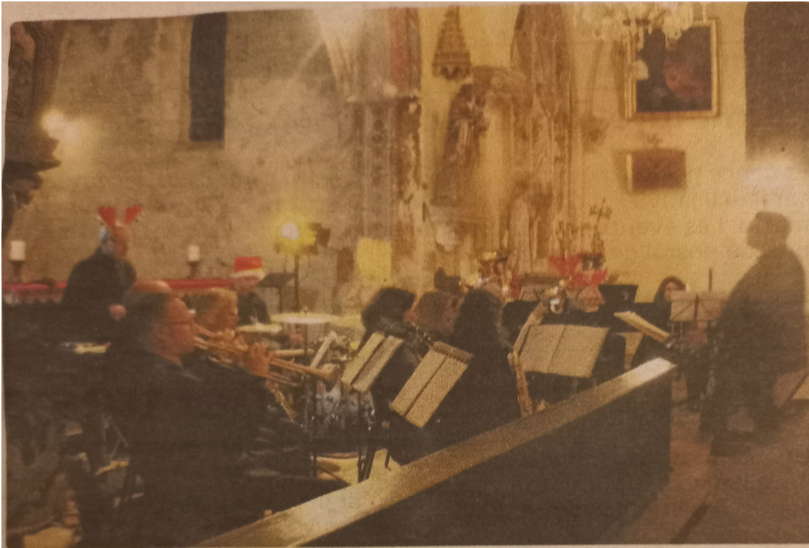
Les Fa Sonneurs de Fayl-Billot ont proposé un concert interactif.

Le concert de Noël a rejoui les nombreux auditeurs bien emmitouflés, dans l'église rénovée et illuminée. Une contribution à la magie de la nuit. Les musiciens charmés par l'accueil des lieux, ont apprécié l'acoustique de l'église. Ils ont promis de revenir !