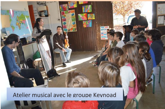
Atelier musical avec le groupe Kevnoad