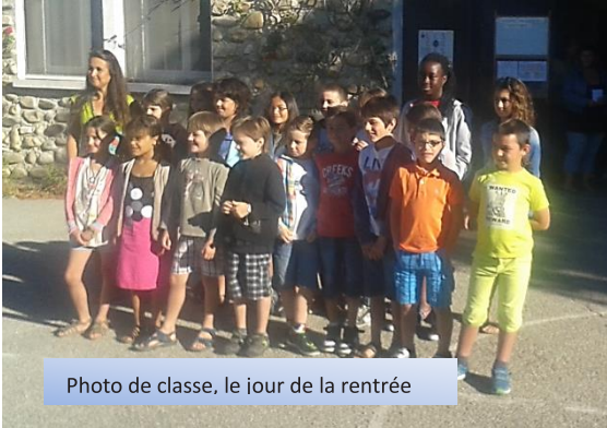
Photo de classe, le jour de la rentrée