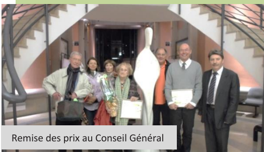
Remise des prix au Conseil Général