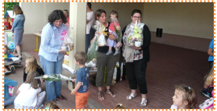
Le 4 juillet, l'école est finie (enfin, pour cette année!)