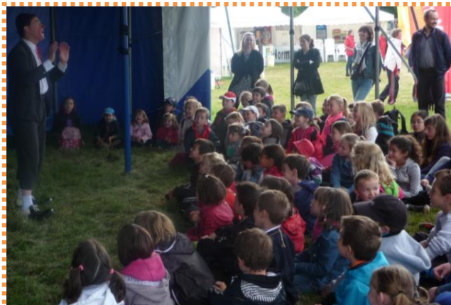
Classe de Mme Gard-Baholet: le 11 avril Visite de Versailles