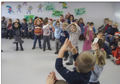
Spectacle de Noël Anga, fils du feu