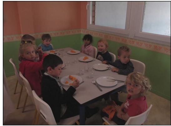
Vie de classe