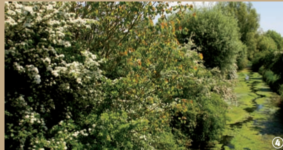
Une rencontre avec Marie Groëtte ?

A la nuit tombante, elle rôde le long des berges, les pieds dans l'eau, et se cache près des aulnes ou des racines de vieux saules, guettant l'enfant imprudent qui se penchera trop vers la rivière... Si